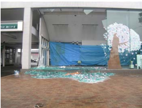
写真-34 ショーウィンドウの割れ