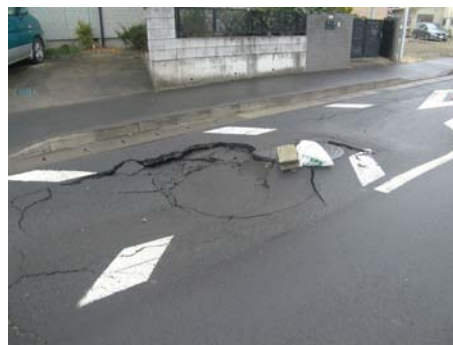
写真-35 マンホールの隆起