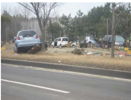
写真-25 津波被害を受けた車輛群