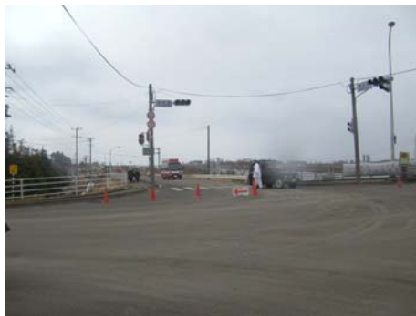
写真-23 高砂橋交差点(立入禁止区域)