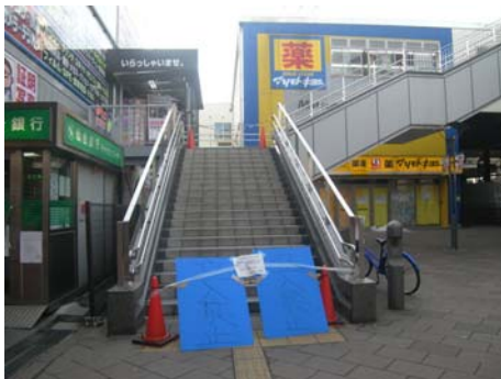
写真-1 東口連絡階段閉鎖