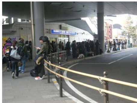
写真-2 高速バス乗車券売り場の行列