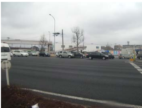
写真-19 横断歩道橋取付階段部の落橋