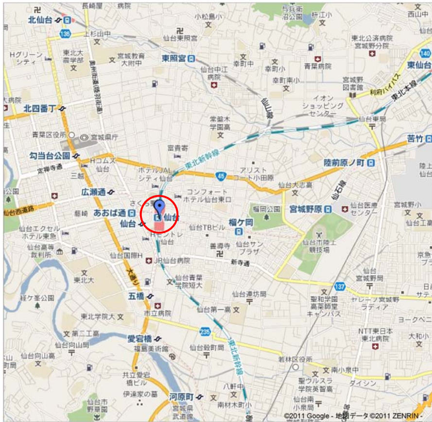
図-2 仙台駅周辺位置図

仙台駅は、震災後閉鎖されている。高速バスの乗車券売り場には、乗車券を求める行列ができていた。仙台駅周辺の被災状況としては、路面の沈下、建物外壁の損傷が発生している。