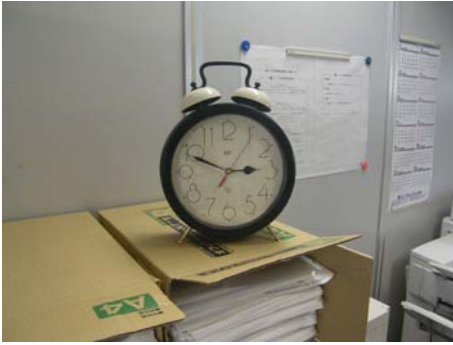
写真-28 震災時に壊れた時計