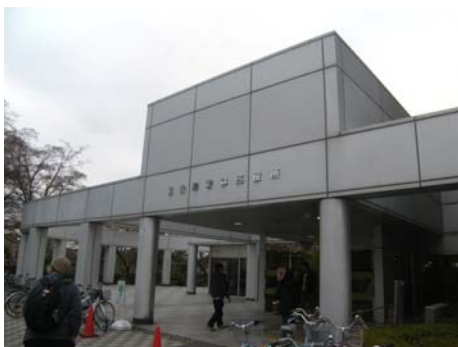
写真-7 若林区役所庁舎