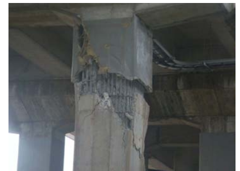
写真-16 橋脚補強部での損傷 (長町駅周辺)