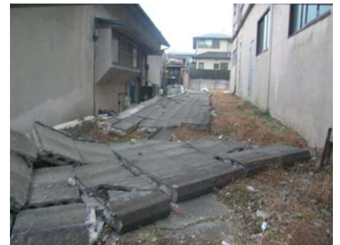
写真-33 ブロック塀の倒壊