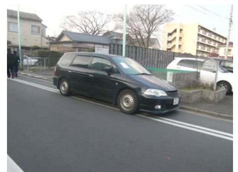
写真-39 ガス欠で放置された車輛