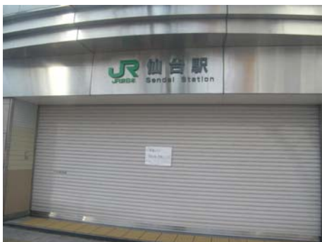
写真-4 東口地下道閉鎖