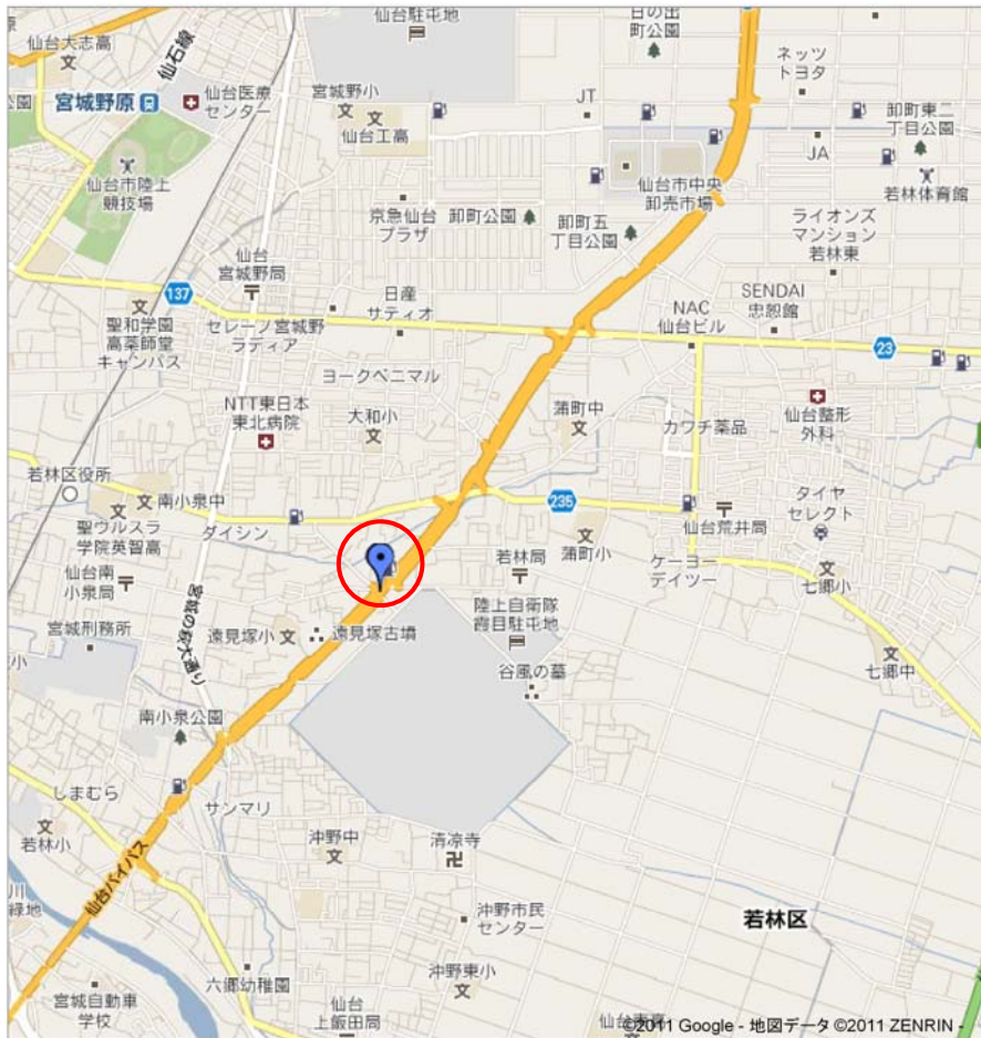
図-5 歩道橋落橋位置図