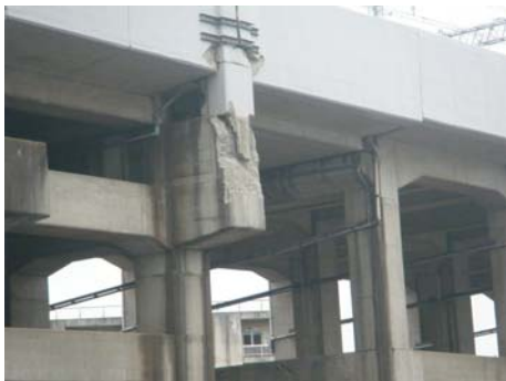
写真-11 架線支柱基部の損傷 (仙台駅北側)