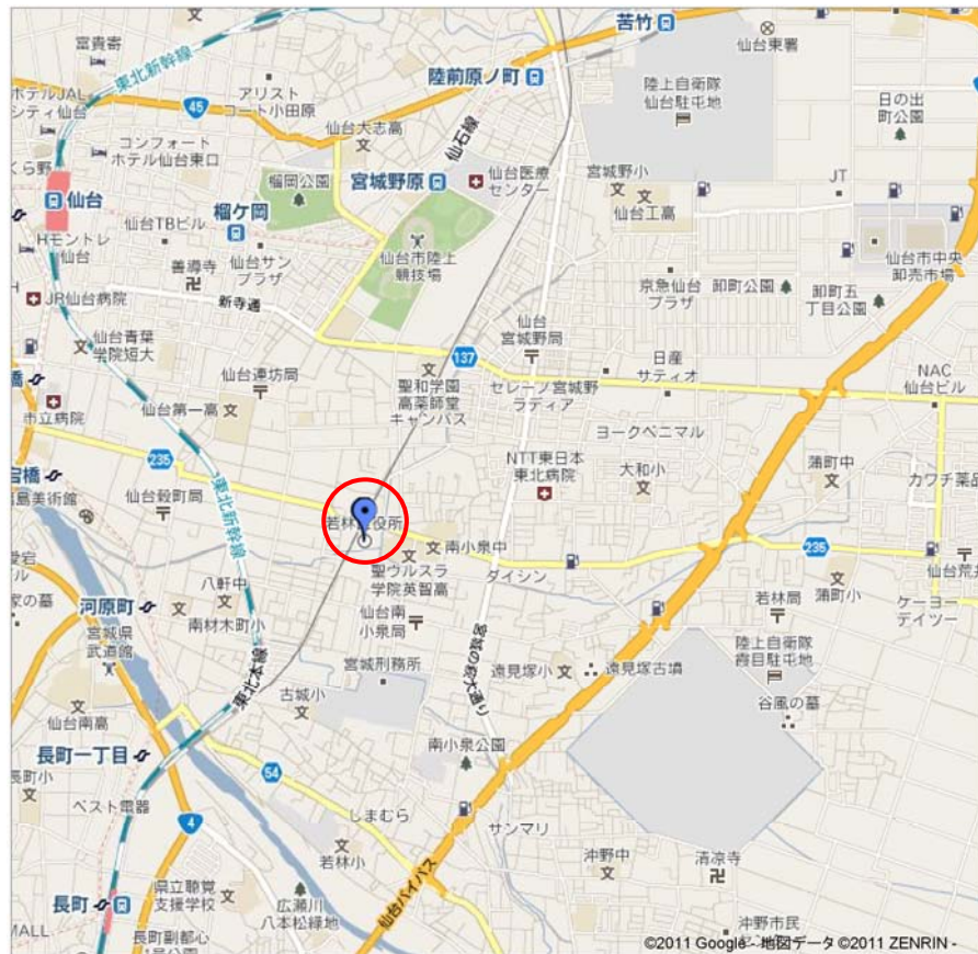
図-3 若林区役所位置図

仙台市内で、最も津波の被害を受けた若林区の区役所には、支援物資が到着していた。庁舎内は、一時避難所として開放されている。