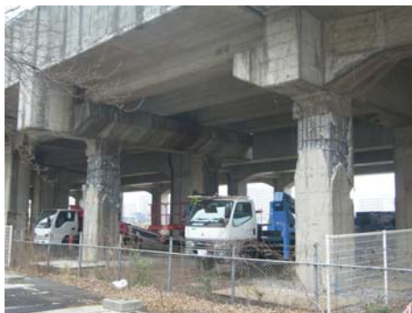
写真-15 ラーメン橋脚の損傷 (長町駅周辺)