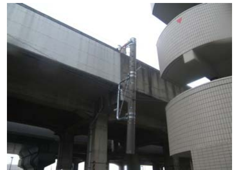
写真-13 架線支柱の折れ (長町駅周辺)