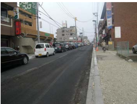
写真-37 ガソリンを買い求める車列