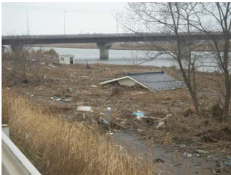
写真-22 津波により流出した家屋