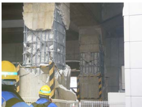
写真-14 ラーメン橋脚の損傷 (長町駅周辺)