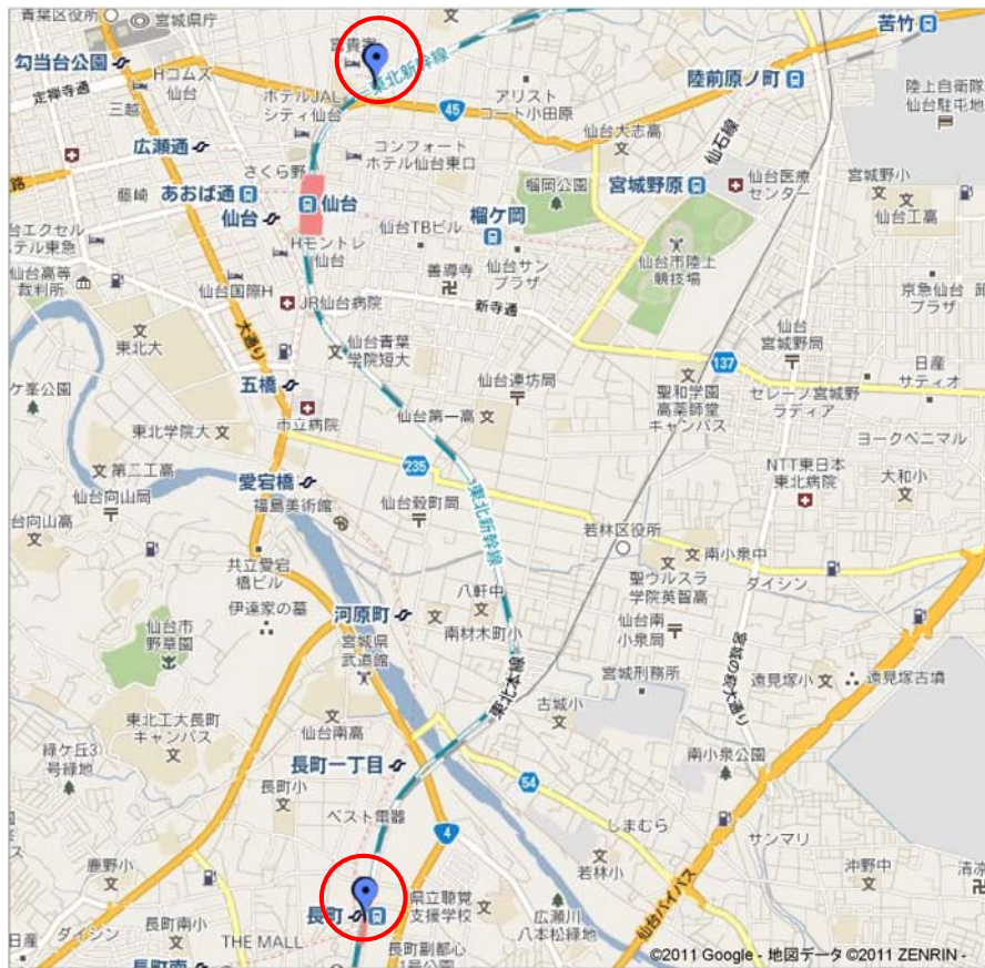
図-4 東北新幹線橋脚損傷位置図

東北新幹線の橋脚では、仙台駅の北側および長町駅周辺で損傷が発生していた。また、新幹線の架線を支持するコンクリート製の支柱が折れる損傷も発生していた。既に、損傷を受けた箇所の補修工事が開始されている。