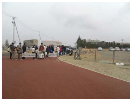
写真-38 給水を求める行列