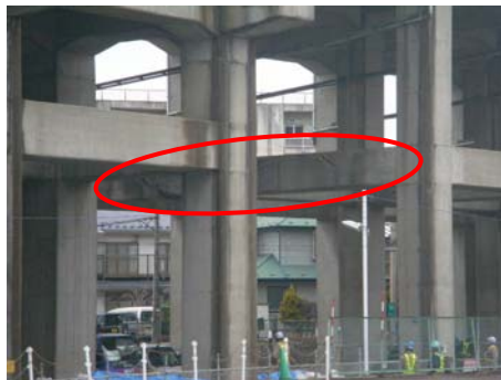
写真-12 二層ラーメン橋脚横梁の損傷 (仙台駅北側)