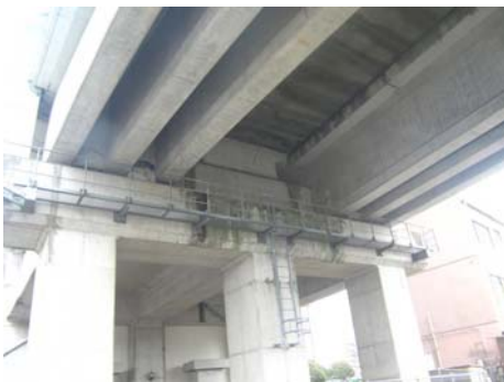
写真-17 上部工横桁の損傷