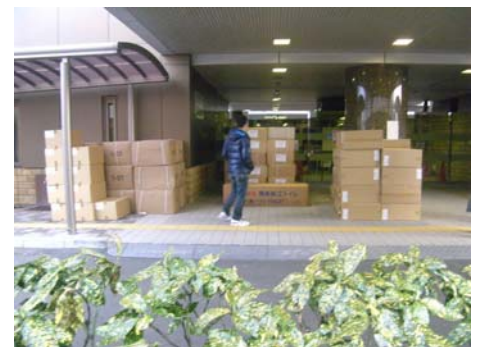
写真-9 支援物資(簡易トイレ)