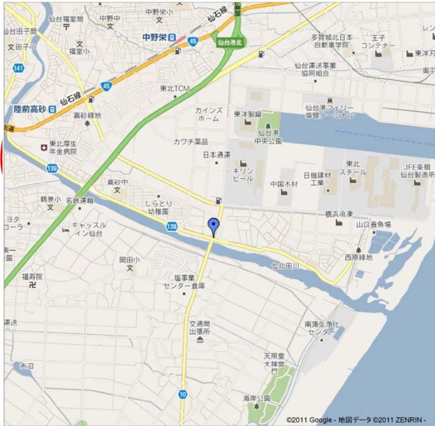
図-6 七北川河口位置図

七北川河口では、津波により流された家屋、車、キリン工場から流出した大量の缶類が散乱している。高砂橋より先の河口部は立入禁止区域となっている。