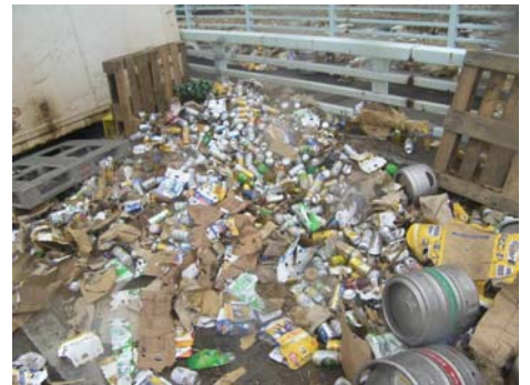
写真-24 流出した大量の缶類