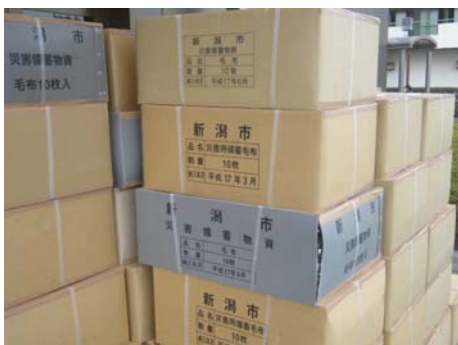
写真-10 支援物資(毛布)