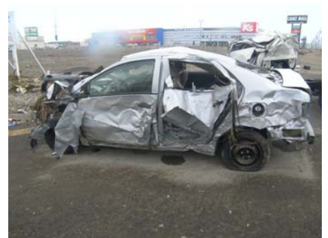
写真-27 大破した車輛