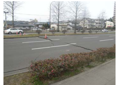
写真-36 ボックスカルバート背面の沈下